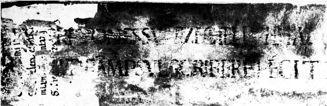
Cod. 1003. Einbandrücken