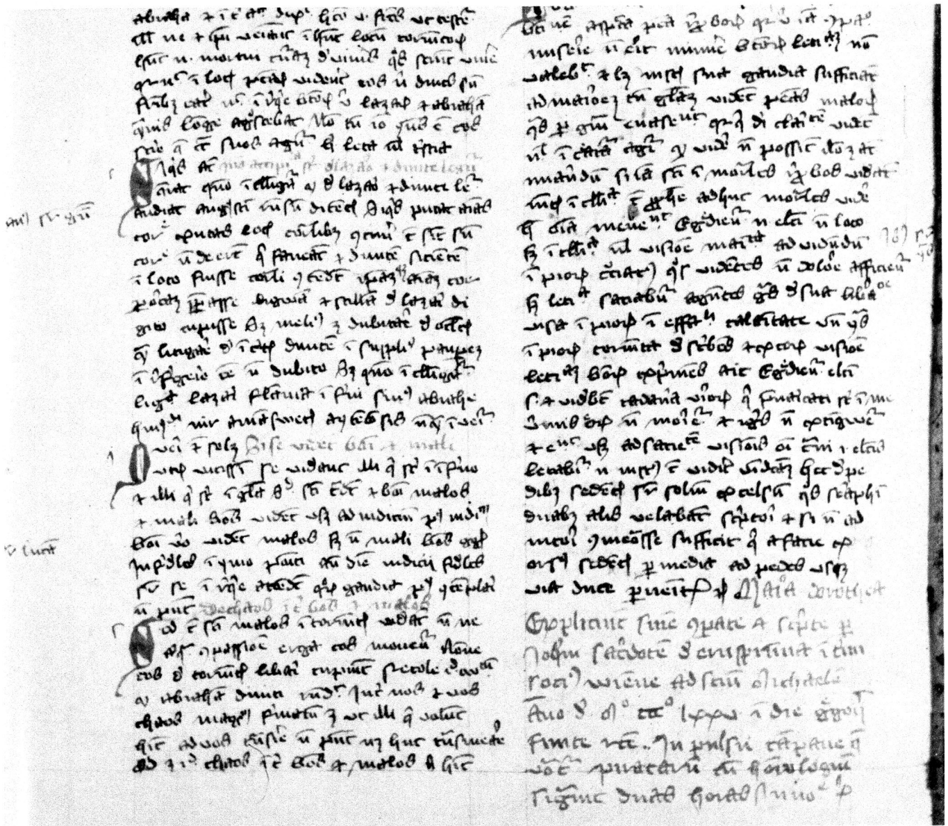
Cod. 4863, fol. 139v